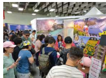
旅行博などのイベント運営及び対応