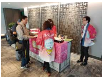
商談会及びレセプションの運営