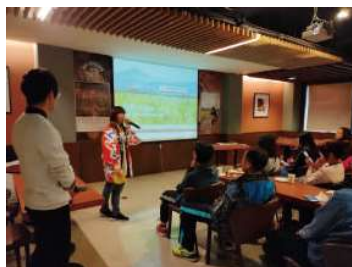
旅行者向けの旅行情報プレゼンテーション