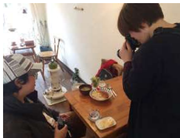
インフルエンサーの取材手配及び情報発信のフォロー