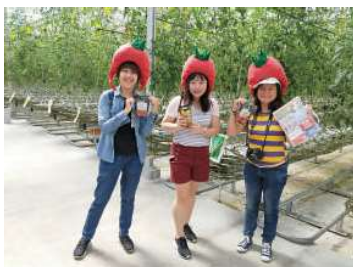
航空会社・旅行会社等の招聘