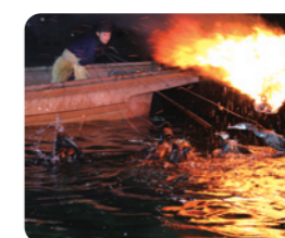
◎宇治川鷗鷺捕魚表演