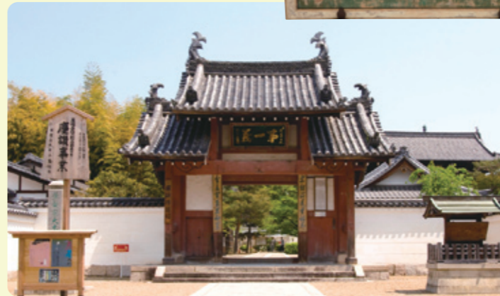
具有異國情調的中國式寺廟