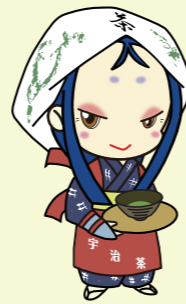
宇治市宣傳大使 拚博公主

“日本茶800年之歷史散步”~京都·山城，是指由宇治市以及京都府南部8個行政單位(宇治市、城陽市、八幡市、京田邊市、木津川市、宇治田原町、和束町、南山城村)所在的茶葉相關文化財產26件組成的宇治茶800年歷史的載體，在宇治市內，有“黃蘗山萬福寺”“中宇治街道”“白川地區茶田”等16件組成的文化財產群。