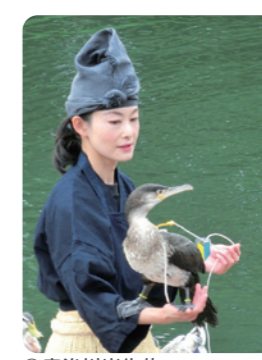
◎宇治川出生的“海鷗鷺阿烏”