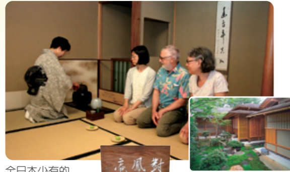
全日本少有的 市營茶室