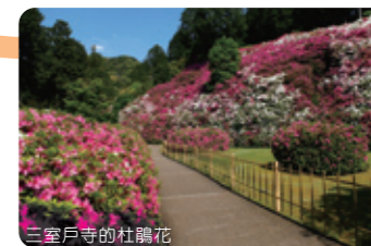
三室戶寺的杜鵑花

地處太陽之丘西鄰，占地約10公頃的植物園。園內有花與水構成的巨型花壇、花園廣場、香草園等。 ●垂詢電話/0774-39-9387 ●開園時間/9:00~17:00 (入園16:00為止) ●公園休息日/星期一、年末年初 ●地址/宇治市廣野町八軒屋谷25-1 ●自JR・京阪“宇治站”或近鐵“大久保站”乘巴士至“太陽之丘”下車