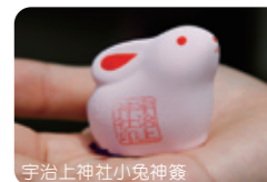
宇治上神社小免神龕