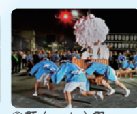
◎縣 (agata) 祭