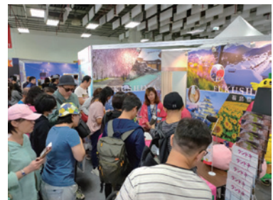
旅行博などのイベント運営及び対応