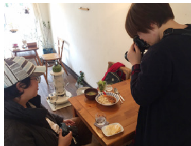
インフルエンサーの取材手配及び情報発信のフォロー