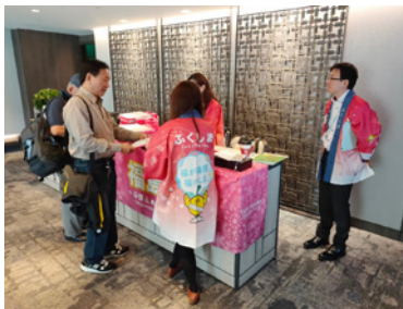
商談会及びレセプションの運営