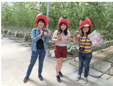
航空会社・旅行会社等の招聘