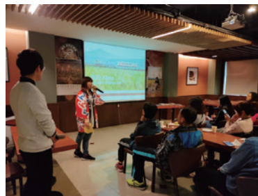
旅行者向けの旅行情報プレゼンテーション